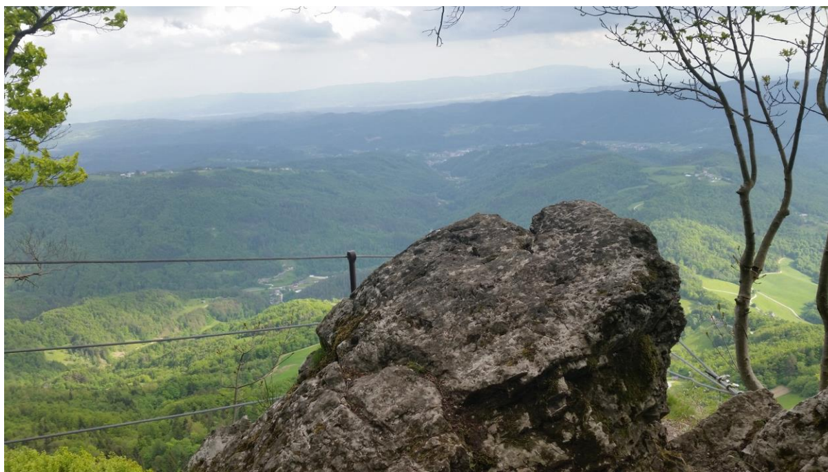
Zaključek plezalne poti

* Uradnih slovenskih prevodov ni, zato je besedna razlaga težavnosti zgolj moj prevod iz nemščine.