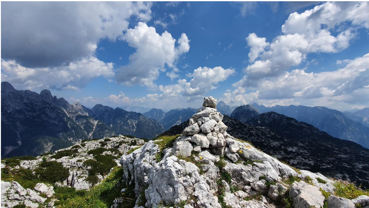
Pogled z vrha